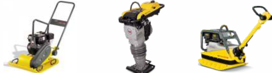
Compactadores de Solo