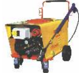
Hidrojeateadora de Areia