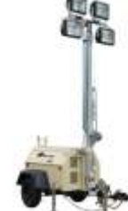
Torre de Iluminação