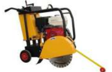
Serra p/ Asfalto e Concreto