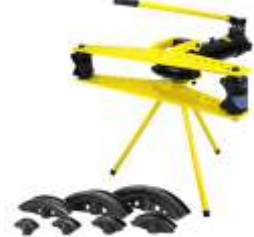
Dobradeira de Tubo