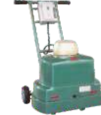
Politriz de Piso