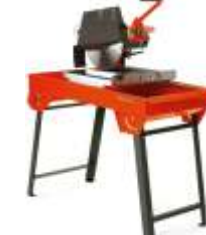
Serra de Bancada p/ Bloco e Granito