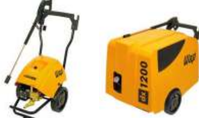
Lavadora de Alta Pressão