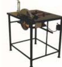
Serra de Bancada p/ Madeira