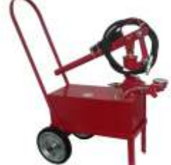
Bomba para Teste Hidrostático