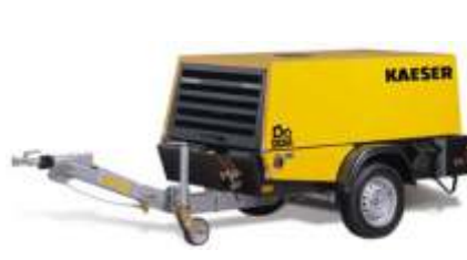
Compressores de Ar