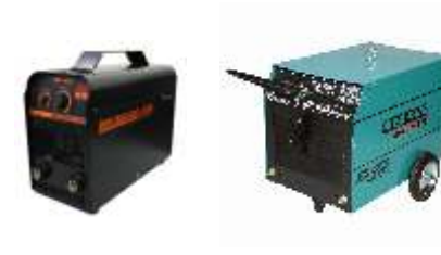
Máquina de Solda